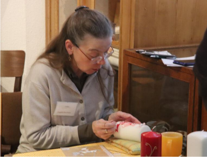
Live Vorführung Kerzenverzierung im Museum Abstküche in Velbert