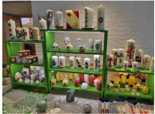
Frühjahr auf dem Kreativmarkt im TUK Bad Sassendorf