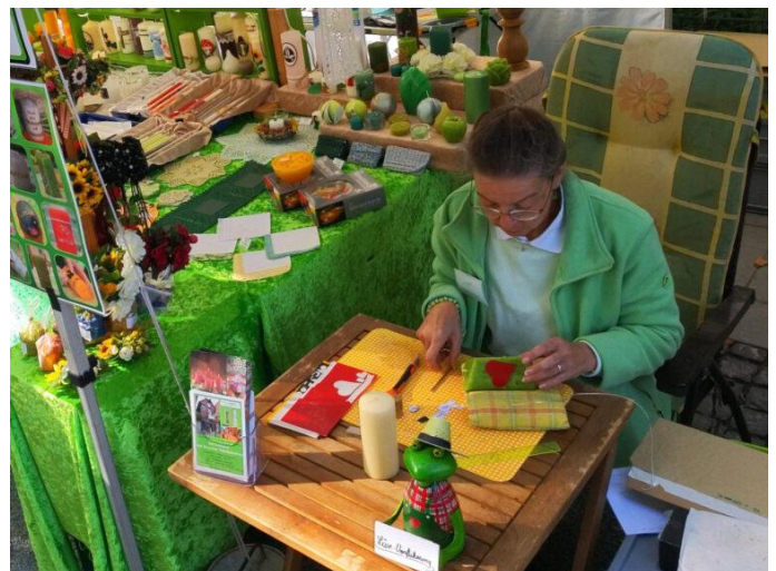
Live Vorführung Herbstmarkt Bad Sassendorf