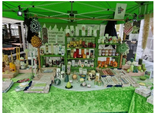
Hansemarkt Kamen Innenansicht von meinem Stand