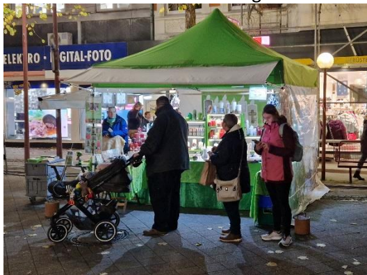
Kundschaft an meinem Stand