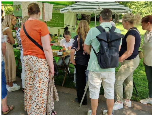
Gartenlust im Westfalenpark Publikumsmagnet Live Demonstration