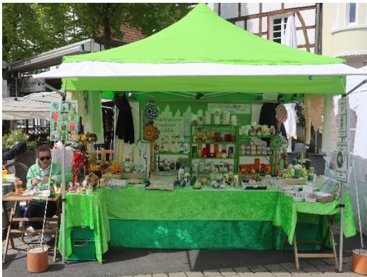
Hansemarkt Kamen Außenstand