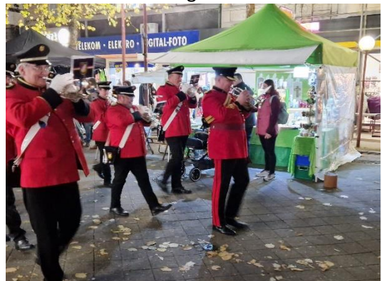
Ein Tusch für meine Kerzen