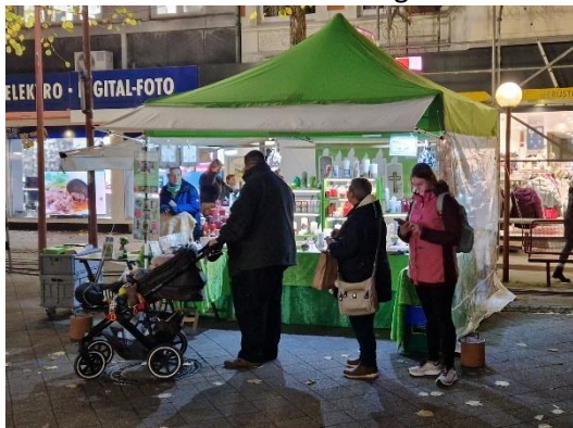
Kundschaft an meinem Stand