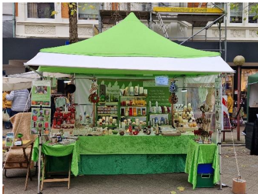
Martinsmarkt Gevelsberg Herbst