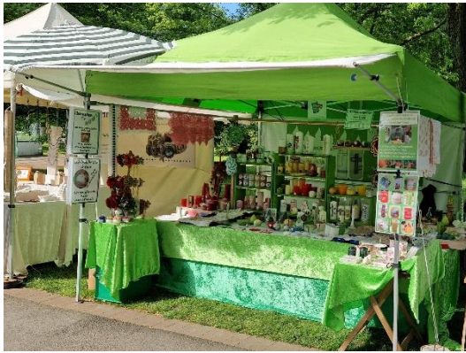
Mein Stand auf dem Markt Gartenlust im Westfalenpark