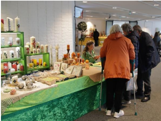
Live Demonstration Kerzen Verzieren im TUK Bad Sassendorf