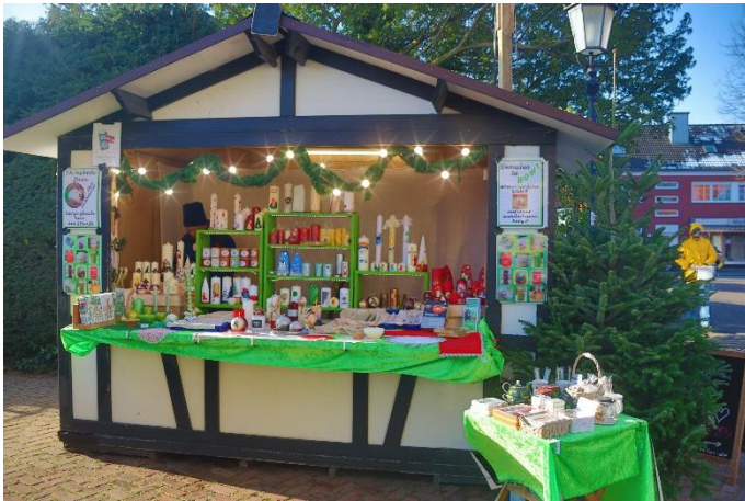
Weihnachtsmarkt mit Markthütte Rosendorf Seppenrade 1ter Advent