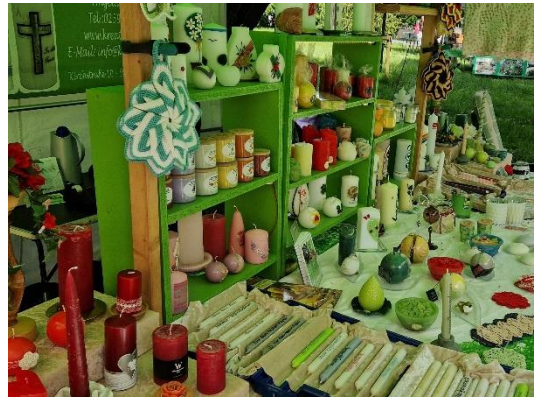
Gartenlust im Westfalenpark Innenansicht von meinem Stand