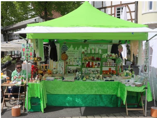
Hansemarkt Kamen Außenstand