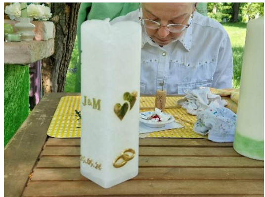
Eine Kerze sofort verziert im Kundenauftrag auf dem Stand