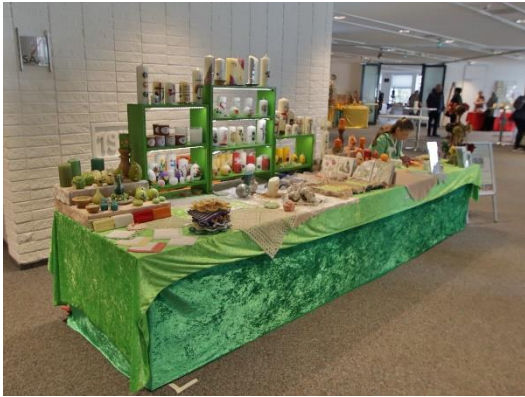
Innenstand im TUK Bad Sassendorf im Frühjahr