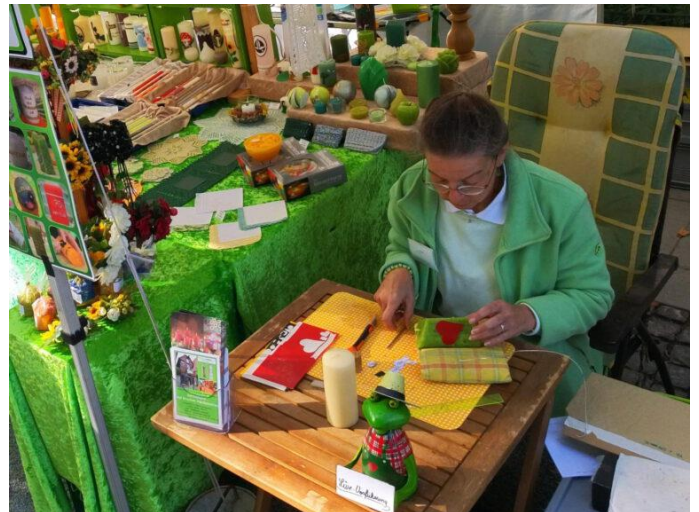
Live Vorführung Herbstmarkt Bad Sassendorf