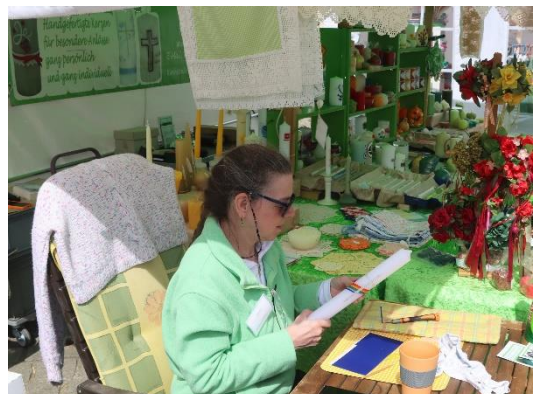
Hansemarkt Kamen Live Vorführung