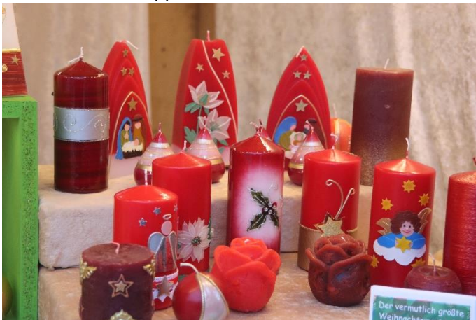
Handverzierte Weihnachtskerzen in Seppenrade