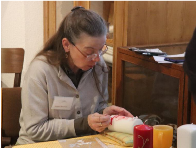
Live Vorführung Kerzenverzierung im Museum Abstküche in Velbert