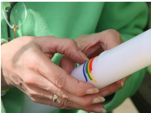
Hansemarkt Kamen Verzierung einer Taufkerze