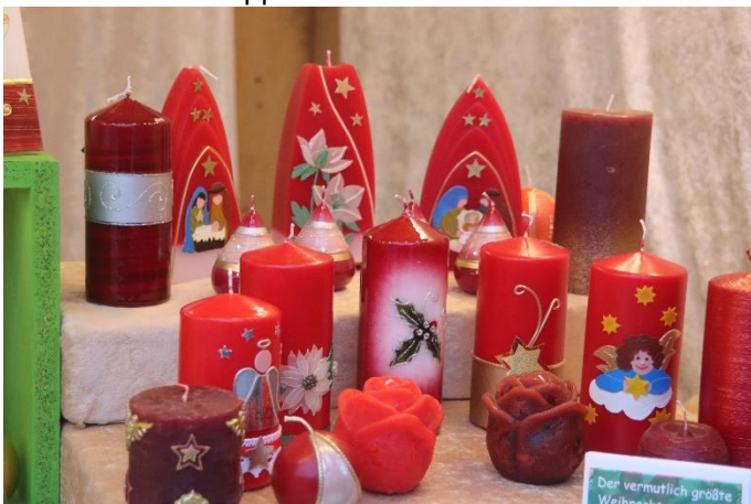
Handverzierte Weihnachtskerzen in Seppenrade