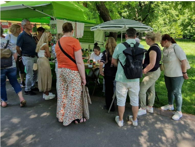
Live Vorführung Kerzen Verzieren im Westfalenpark Dortmund 2024