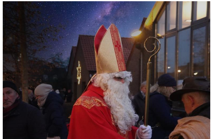
Live Vorführung Kerzen Verzieren für den Nikolaus