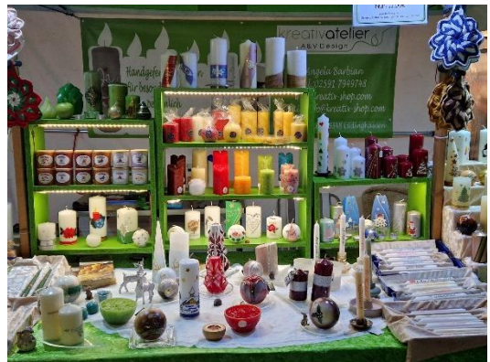
Martinsmarkt Gevelsberg Innenansicht vom Stand