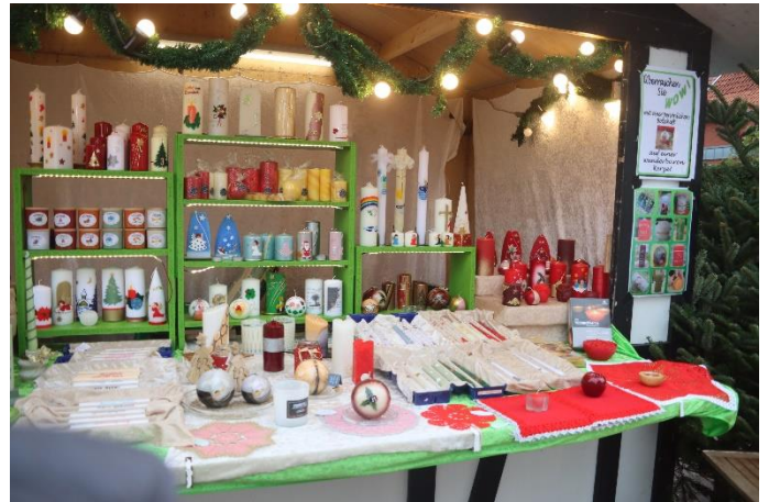
Weihnachtsmarkt in Lüdinghausen Seppenrade Innenansicht meines Standes