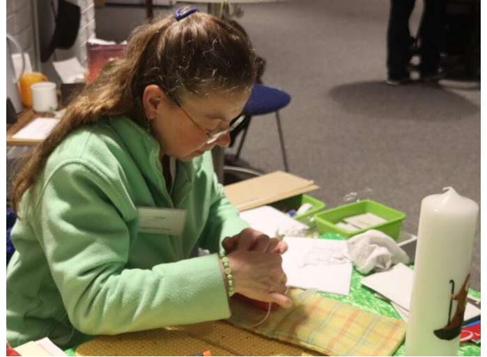
Live Vorführung Kerzen Verzieren im Tuk Bad Sassendorf Weihnachten 2023