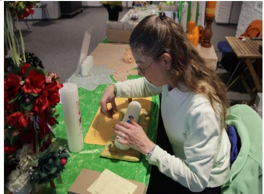
Live Vorführung Verzierung einer Taufkerze